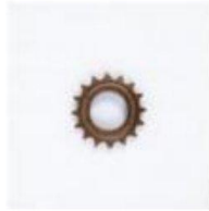
飞轮 / Free Wheel