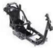
车 架 /Frame