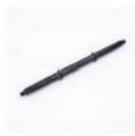
中轴 / Middle Axle