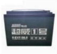
电 池 /Battery /Saddle