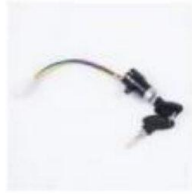
电锁 / Electric Lock