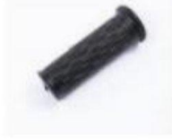
转把 / Handle