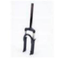
前叉 / Front Fork