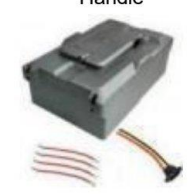
电池盒 /Battery Box