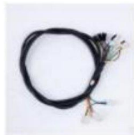
线束 / Wire Hamess