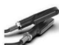
转向灯 /Turn Signal