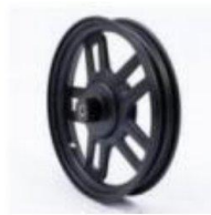
前图 /Front Circle