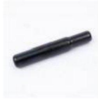
座杆 / Seat Posts