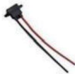
充电接口 /Charging Interface