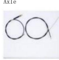
刹车线 / Brake Cable