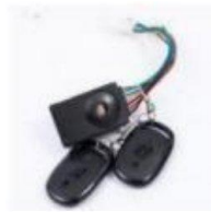
防盗器 /Burglar Alarm