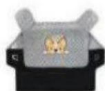
挡风被 / Wind proof Quit