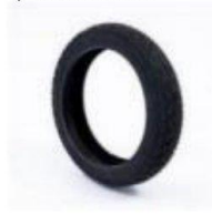
真空胎 / Vacuum Tyre