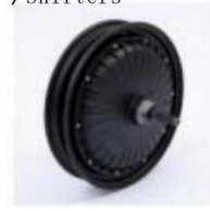
电机 /Electric Machinery