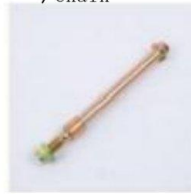
前轴 / Front Axle