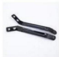
后泥瓦撑 /Rear Mud Tile Support