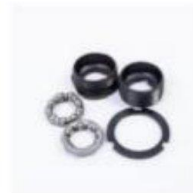
中轴配件 / Axle Accessories